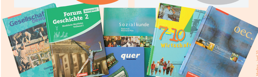
Schulbücher: Auswahl von 155 Schulbüchern, die für gesellschaftswissenschaftliche Fächer in der Sekundarstufe I und II zugelassen sind; Quelle: Institut der deutschen Wirtschaft Köln